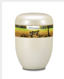
Gehoben (U6) Naturstoff - Park